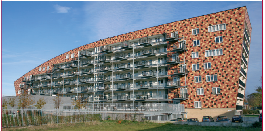
Harlekijn onder beheer van l'escaut woonservice

Onderhoudsbeheer is nodig om het lopende en klein onderhoud te waarborgen en om ervoor te zorgen dat het groot onderhoud gepland en uitgevoerd kan worden. Het lopend en klein onderhoud vereist een jaarbegroting met posten voor o.a. onderhoud van liften, portiekverlichting, deurtelefoon, schoonmaken